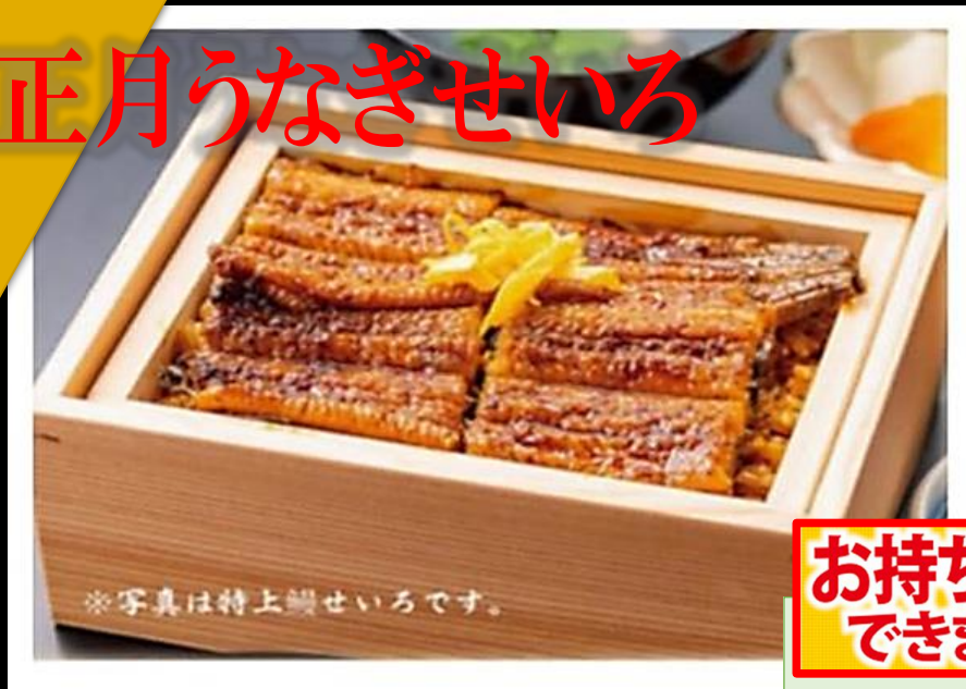
※写真は特上鰻せいろです。